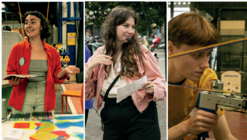
Pictures from previous Journées du Matrimoine.

Brussels celebrates its fifth edition of Journées du Matrimoine this weekend, highlighting the contribution of women to Belgian heritage through a series of free events including guided tours, workshops and conferences.