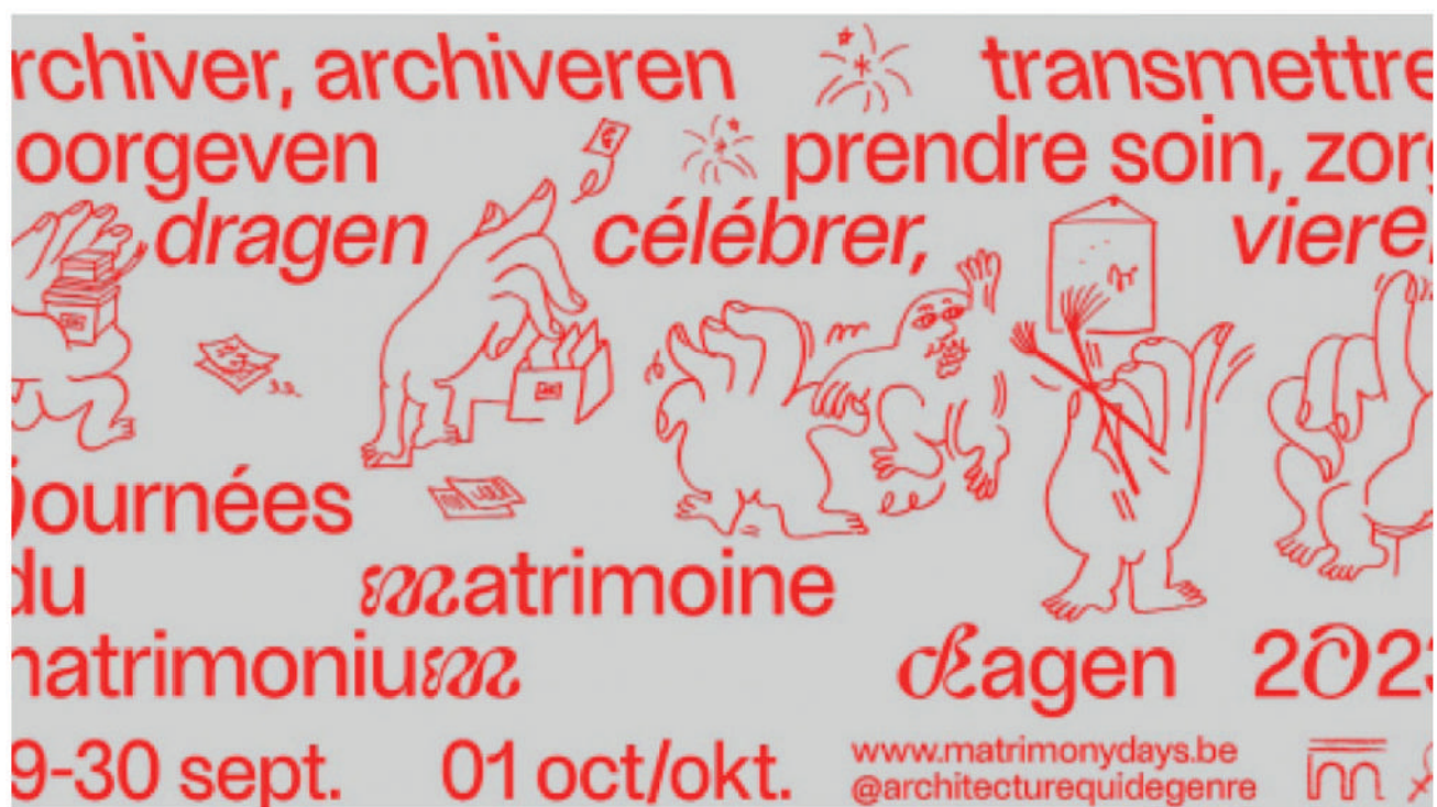
L'affiche 2023. - ASBL architecture qui dégenre

Les Journées du Matrimoine vont ainsi fêter cet automne leur 5e anniversaire. Elles ont pour objectif de valoriser les personnes, œuvres, métiers et espaces souvent invisibilisés, qui ont joué un rôle essentiel dans l'histoire et la culture bruxelloise.